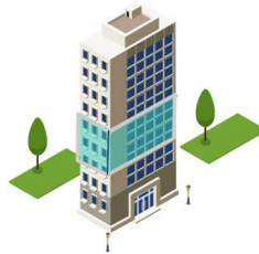
Cas n° 2